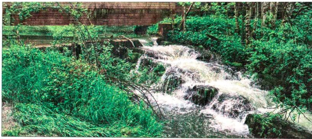
La passe à poissons réalisée en amont du lac et la seconde passerelle d'observation.

Au début des années 1980, le lac de Lucelle était menacé d'enlèvement et la qualité de l'eau était si mauvaise que la plupart des poissons périssaient. Il fut décidé d'enlever les sédiments accumulés au fond du lac.